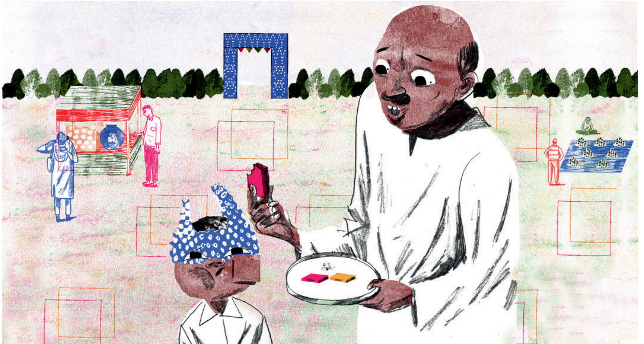
Mkate wa aina wa barfi ni wa mraba.