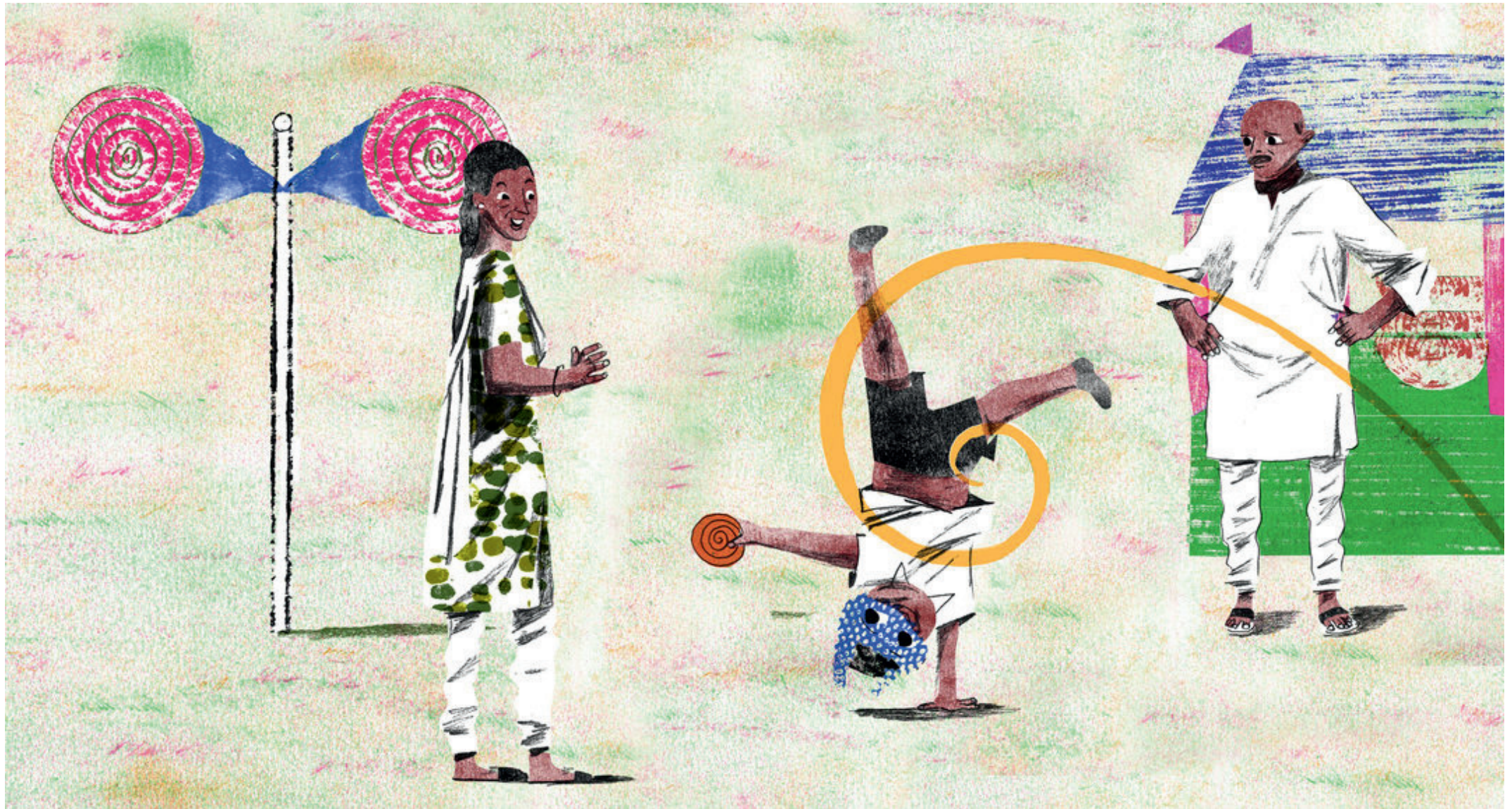
Mkate wa Chakili ni wa msokoto.