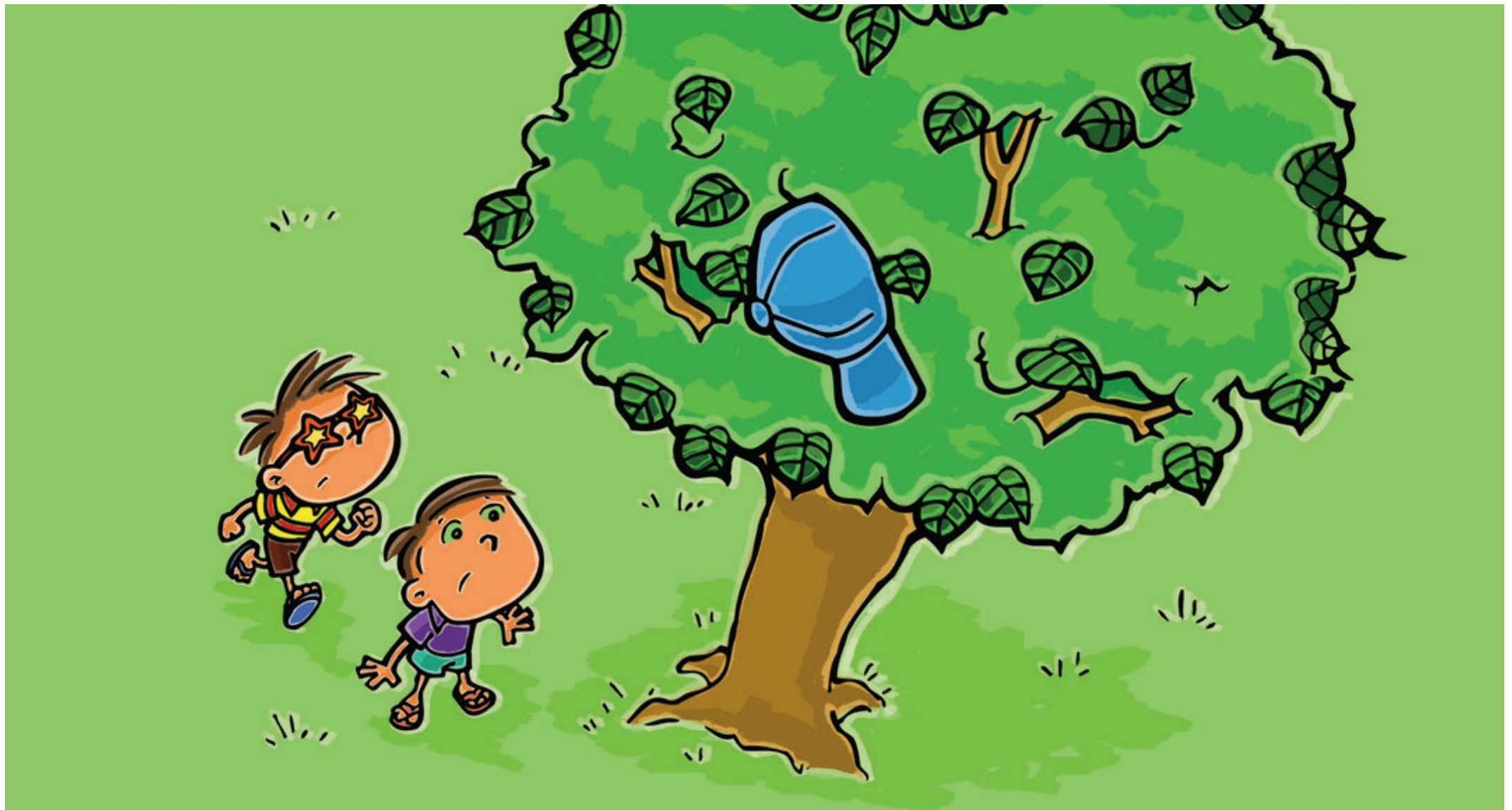
Kofia yangu ilizuiliwa katika matawi ya mti wa miiba.